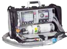
LIFE-BASE 3 NG avec MEDUCORE Standard et MEDUMAT Standard 2