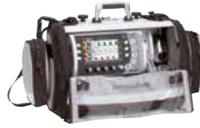
LIFE-BASE 4 NG avec MEDUMAT Transport