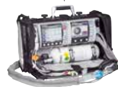
LIFE-BASE 3 NG avec MEDUCORE Standard et MEDUMAT Standard²