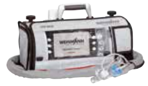
LIFE-BASE 1 NG avec MEDUMAT Transport