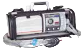
LIFE-BASE 1 NG XL avec MEDUMAT Standard²