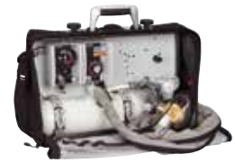
LIFE-BASE III avec MODUL CPAP et MEDUMAT Easy CPR